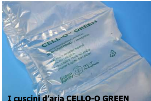
I cuscini d'aria CELLO-O GREEN

Oltre ad un'eccellente protezione, essi offrono ai clienti il vantaggio di ridurre il materiale da imballaggio. CELL-O GREEN costa meno dei cuscini d'aria a base di amido, è più facile da utilizzare per chi imballa ed è più gradevole da maneggiare rispetto alla carta arricciata o imbottita.